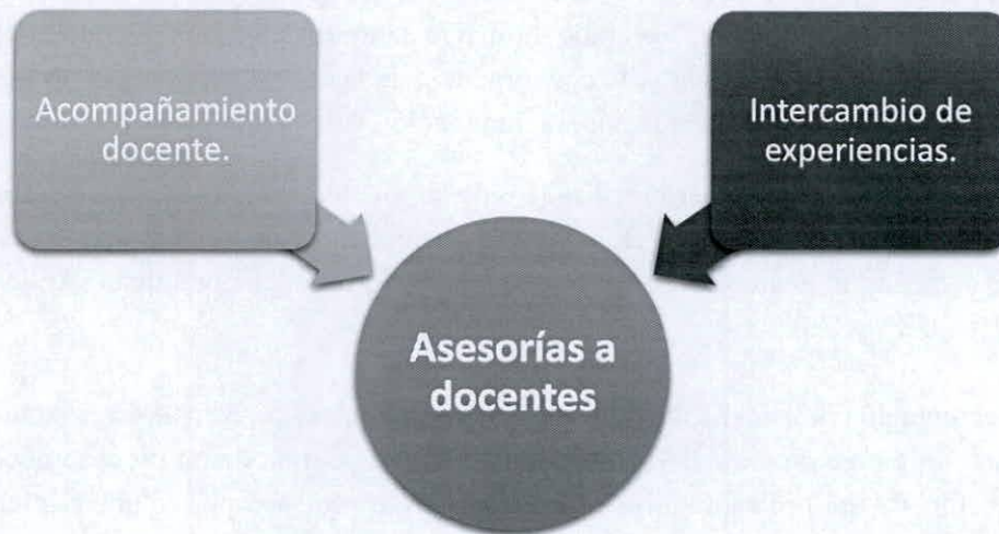
Imagen 1. Asesorías a Docentes.

Así, los docentes PUCE de acuerdo a sus necesidades seleccionará el espacio idóneo: