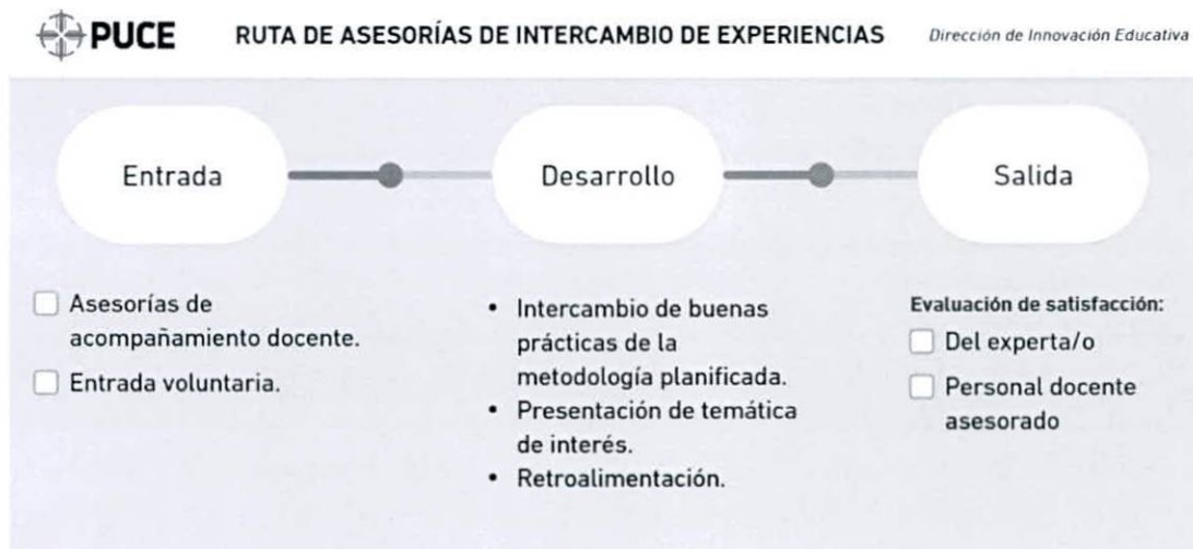
Figura 2 - Asesorías de intercambio de experiencias

La ruta de las asesorías de intercambio de experiencias cuenta con tres pilares fundamentales, que permiten el desarrollo del proceso. El principal objetivo es dar a conocer la implementación de las metodologías a partir de buenas prácticas. La temporalidad de estas asesorías, se realizará cada tres meses, y será liderada y convocada por los gestores de asesorías; el cronograma estará dentro de un formulario online de solicitud de participación en las asesorías de intercambio de experiencias (anexo) que será actualizado de manera periódica y donde los docentes PUCE podrán agendar su participación en el mencionado espacio, disponible en la página web de la PUCE. Al finalizar el espacio se contará con un acta de acuerdos y firmas de responsabilidad.